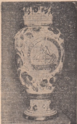
Trofeul oferit rugbystilor români pentru cîștigarea turneului de la Harkov