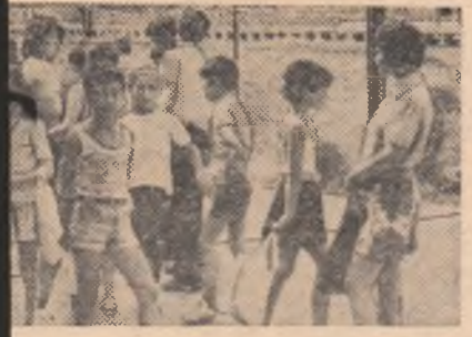
Programul bazinului de la Școala generală de la Mureș. Dar porțile sînt încă închise și