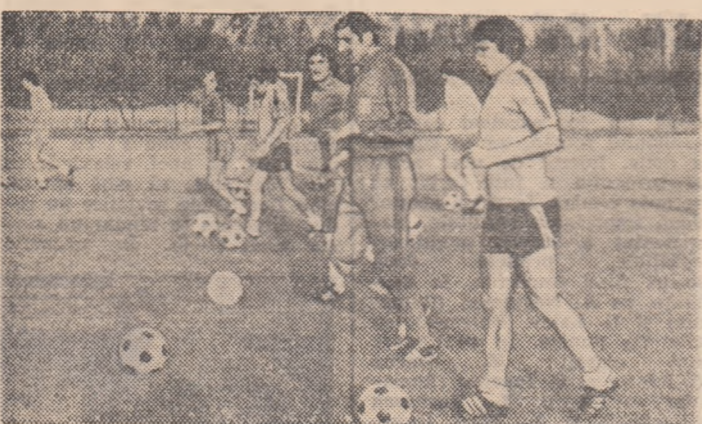
Abia reînțorși în București, steliștii se antrenează de zor