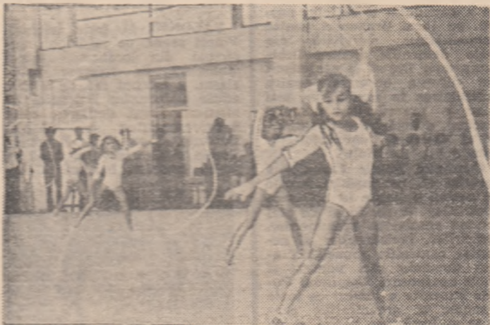
Șerpuitoarele panglici albe ale fetițelor Liceului agroindustrial din Roznov...