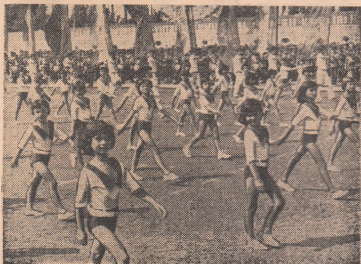
Printre aceste felije — urmașele Nadiei și ale Teodoresc...

„Semnal de trompeți, răpăit de tobe și, în acordurile unui marș vlot, coloana sportivilor pătrunde în marea piață. Tineri și tinere, în costume albe, imaculate, poartă portretul tovarășului Nicolae Ceaușescu, încădrat de stemele partidului și țării. O mare de steaguri tri-