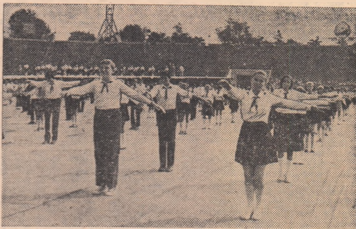
Prin exercițiile lor, șoimii patriei și pionierii vor sugera preocupările lor zilnice — învățătura, munca, sportul —, copilăria lor fericită.

După cum am anunțat, la 23 septembrie va avea loc pe stadionul „23 August” din Capitală un grandios spectacol sportiv, care va marca închiderea actualei ediții a marilor competiții sportive naționale „Daciaada”. Vă prezentăm astăzi aspecte din pregătirile reprizei șoimilor patriei și pionierilor.