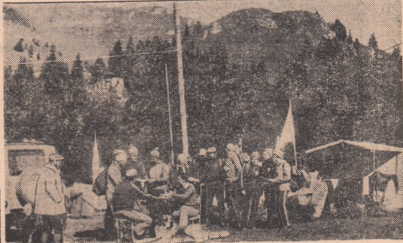
Înainte de plecarea într-o probă, echipele consultă hărțile, sub îndrumarea arbitrilor de start