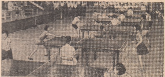
Tenisul de masă — disciplină sportivă care plasează R.P.D. Coreeană printre cele mai bune din lume — se bucură de o mare popularitate în rîndul tineretului

cind date importante ale luptei de eliberare a patriei. Mii de tineri își desăvîrșesc pregătirea fizică și sportivă participînd la competiții de masă, în cadrul unor discipline deosebite de mult îndrăgite, cum sînt luptele, tirul cu arcul, voleiul, tenisul de masă, diferite probe atletice. Anul trecut, cu prilejul sărbătorii naționale de la 9 septembrie, 70.000 de sportivi, tineri scolare și copii din Phenian au participat, pe stadionul Moranbon, la o uriasă demonstrație de ansamblu intitulată „Sub steagul Partidului Muncii”. Avîntul mișcării sportive