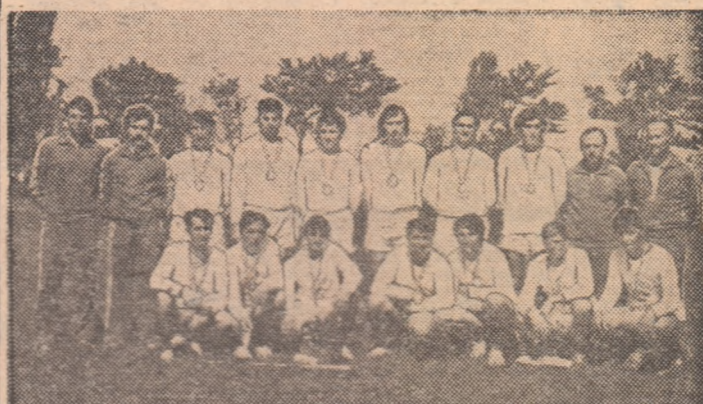
Echipa oiniștilor din comuna Oleni, județul Teleorman, campioană națională satească pe anul 1978