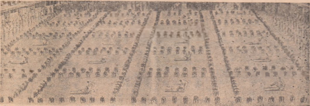
Tinerii ostasi redau aspecte din pregătirea lor fizică și sportivă