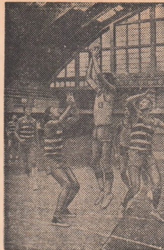
Atac al selecționatelor județului Timiș în întîlnirea cu selecționata județului Galați, în cursul căreia bătăntorii au manifestat un puternic reviriment față de evoluția din meciul anterior.

masculin pe echipe, cu exerciții liber alese, iar de la 19 — concursul feminin cu exerciții impuse. Luni, programul prevede, de la ora 16, exerciții liber alese pentru echipele feminine, precum și concursul individual masculin cu exerciții impuse. Marti, de la ora 17, va avea loc concursul pentru desemnarea campionilor la individual compus, la care vor participa primele 24 de gimnaste și primii 12 gimnasti. În sfîrșit, miercuri sînt programate finalele de aparate. În aceste zile, cele mai bune gimnaste și cei mai buni gimnasti ai țării se află reuniți în Capitală, unde își continuă pregătirile pentru startul de duminică după-amiază.