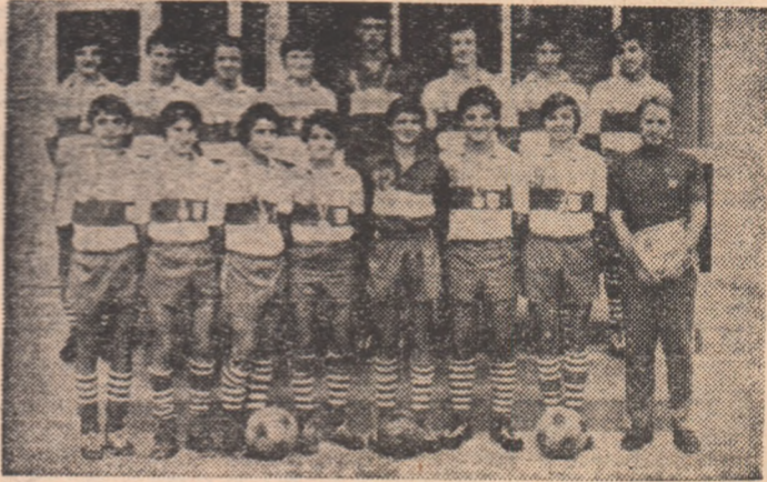
Echipa Școlii generale nr. 10 Timișoara, învingătoare în ediția din acest an a „Criteriului Speranțelor“.