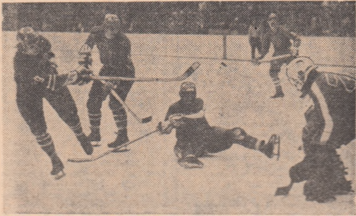
Într-un moment de atac al echipei Steaua, din precedenta sa confruntare în C.C.E., în care a eliminat, după două victorii, pe campioana Bulgariei, Levski Spartak Sofia

Meciul începe la ora 18 și va fi condus de o brigadă de arbitri polonezi, alcătuită din