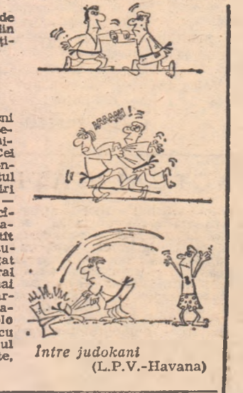
Intre judokani (L.P.V.-Havana)

din NFL (National Football League) sînt preocupate să-și completeze nu numai efectivele de jucători, ci și cele ale „majoretelor”, tinerele dansatoare care defilează pe stadion înaintea meciurilor și în pauză. Rolul lor este acela de a stimula galeeria suporturilor și de a umple un gol în program, alungînd eventual plictiseala unui joc mai puțin atractiv. Cele mai intense eforturi pentru a-și asigura succesul acestor activități de culise par să fie depuse de echipa texană Dallas Cowboys, care a anunțat un mare „trial” pentru angajarea de dansatoare. S-au prezen-