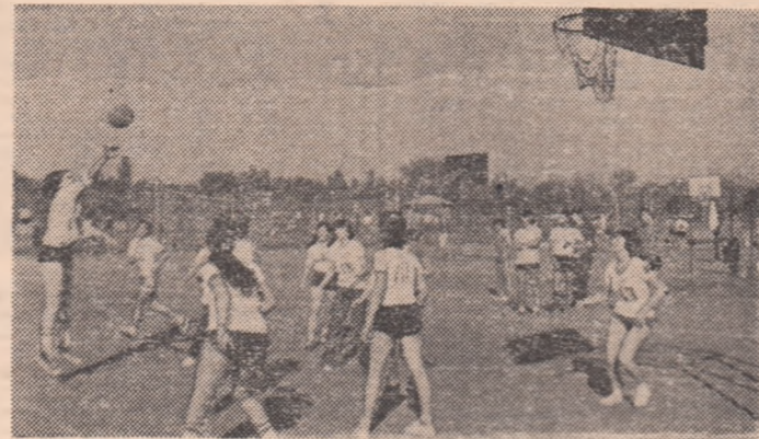
Întreceri viu disputate ale studenților și studențelor de la Politehnică

PROGRESUL BUCUREȘTI — P.T.T. (f) 2-0: 77-62 (48-28) și 73-60 (23-35). Cu mai multă încredere în forțele lor și cu un plus de atenție în minuirea balonului, P.T.T. — promovată anul acesta în Divizia A — putea obține o victorie.