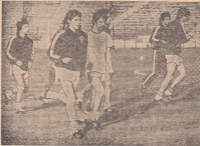
Secvență de la antrenamentul de ieri după-amiază al fotbaliștilor iugoslavi.