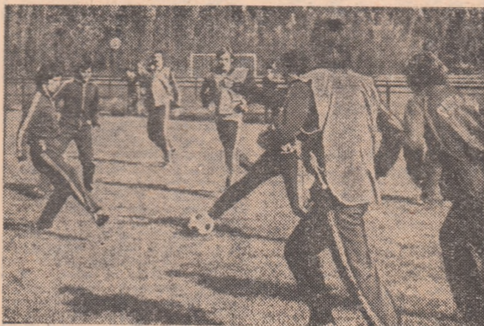
Secvență din „repriza” lecției practice „atacul contra apărării”, care a însemnat încheierea pregătirilor „tricolorilor”

Cu toții, jucători și antrenori, conștienți de importanța partidei de azi, doresc să satisfacă