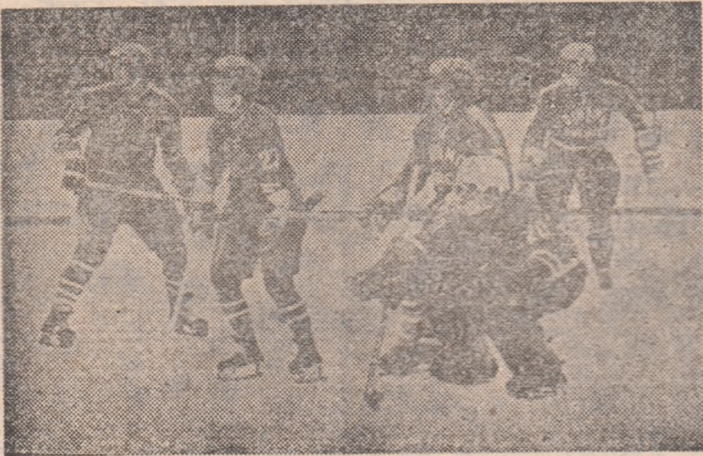
Portarul Netedu a contribuit decisiv la victoria echipei Steaua, în meciul cu Dinamo, de vineri.

Cu meciurile etapei 11-12, programate astăzi și mâine, începe un nou tur, al doilea din cele 4 ale Diviziei A la hochei. În această etapă asiști vor avea loc partidele Dunărea — Steaua (la ora 16) și ASE Sportul studențesc — S.C. Miercurea Ciuc (la ora 18,30), pe patinoarul „23 August” din Capitală, precum și