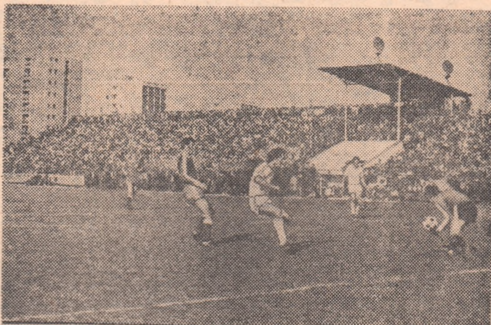
Modernizarea stadionului municipal Gloria — lucrare în curs — este cerută de afluzul tot mai mare al cetățenilor buzoieni la fenomenul sportiv