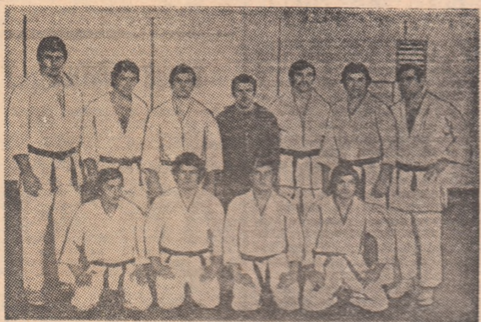
Lotul de judo al echipei Dinamo București care a cucerit cel de al 5-lea titlu de campioană republicană