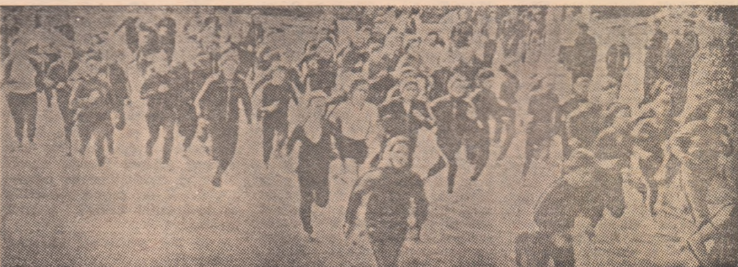
În goană spre sănătate... Crosurile de toamnă, tot mai îndrăgite de liceenii botoșăneni