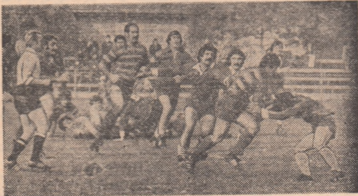
Când se dezlănțuie, XV-le Steaua devine irezistibil. Așa s-au petrecut lucrurile și duminică când a întrecut XV-le Politehnicii din Iași cu 72-9 i lată-i pe rugbyștii militari în pila atac.

Și un ultim detaliu: meciul dintre selecționata universitară de rugby ale României și Franței va fi condus de arbitru italian Natali Cadamurra, delegat special al forului internațional de resort.