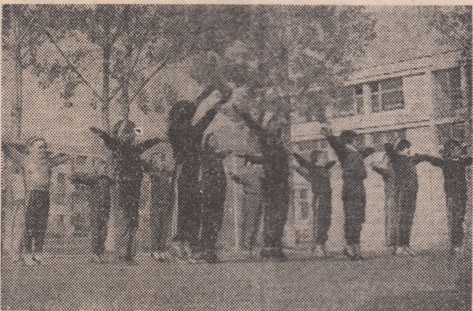
Pentru mulți dintre elevii din școlile municipiului Satu Mare, practicarea exercițiilor fizice și sportului în aer liber, chiar și acum în plină lună noiembrie, este o obișnuință. Cîți dintre voi, dragi elevi, vă străduiți să le urmați exemplul?...

Ediția a II-a a „Topului Sportului” a debutat la Rîmnicu Vilcea