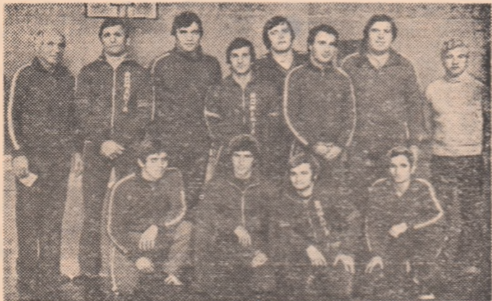
Formația Dinamo, cea nouă campioană la lupte greco-romane