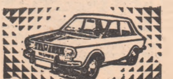
Tragera PRONOXPRES de astăzi, 6 decembrie 1978, poate

CEL MAI POPULAR SISTEM DE LOTERIE își confirmă și de zi avantașele. Numai în ultimele săptămîni, 106 amatori de LOZ IN PLIC au intrat în posesia unor mari cîștiguri: 22 au obținut AUTOTURISME „Dacla 1300” sau „Skoda 105 L”, iar 83 — PREMII IN BANI de 20.000, 10.000 sau 5.000 lei. Bineînțeles, nu sînt de neglijat nici mult mai numeroasele premii de 2.000, 1.000 lei etc. AGENTIILE LOTO - PRONOSPORT, VÎNZĂTORII VOLANȚI, UNITĂȚILE DIN COMERT ȘI COOPERATIA DE CONSUM DIN ÎNTREAGA TARĂ va stau la dispoziție cu lozuri pentru a vă încerca și dv. șansele.