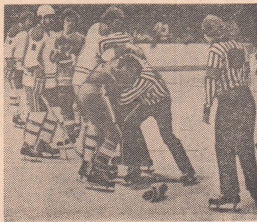
Revista presei străine