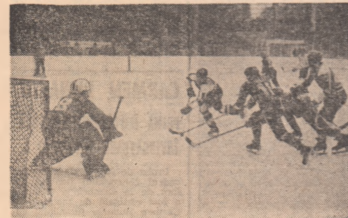
Pe patinoarul acoperit din Galați, moment din meciul inaugural Lăunrea — Steaua. Atacă hocheiștii bucureșteni

Universitatea cultural-științifică, în colaborare cu Consiliul municipal pentru educație fizică și sport București, C.C.E.F.S. și Centrul de perfecționare a cadrelor din C.N.E.F.S., anunță începerea cursului de reciclare cu tema: „Creșterea valorilor cantitative și calitative ale procesului de pregătire din unitățile noastre”. Prezintă cabinetul metodic-științific al clubului sportiv Ștefania. Expunerile vor avea loc în sala Dalles, luni 4 Ianuarie, orele 12,30. Va urma un film artistic.