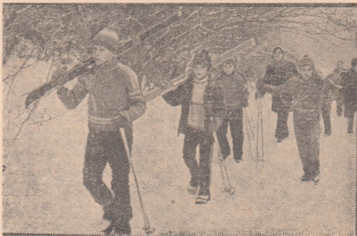
Ultimele zile de vacanță sînt folosite de către elevii bucureșteni pentru agreabile excursii la munte