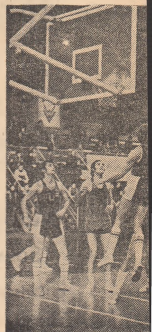
Luptă aprigă în partida Steaua-Napoca. În prim-plan, la de la gaude și Munjo (nr. Fot.

UNIVERSITATEA TIMIȘOARA — FARUL 2-0 : 81-80 (45-40) și 82-81 (40-34). Meciuri extrem de disputate, în