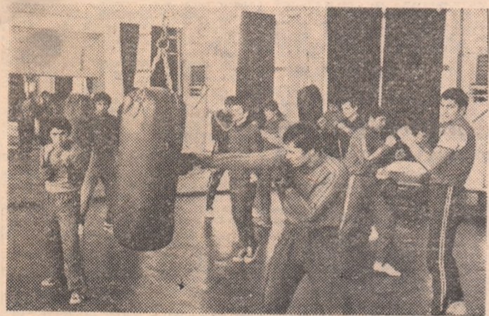
Pugiliștii fruntași pregătesc cu sîrguință viitorul sezon competițional, încă din primele zile ale anului

● Intărirea disciplinei, perfecționarea metodelor de pregătire și atenție permanentă lotului de perspectivă — principalele obiective ale activului federal ● Intense pregătiri la Semenice și la Constanța ● Primele întâlniri de verificare — în Italia, Iugoslavia și Polonia în lunile ianuarie și februarie