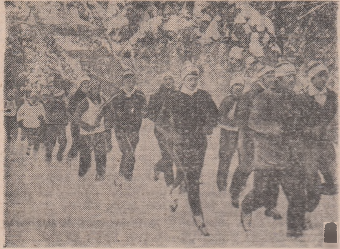
Jucătorii de la S. C. Bacău alergă, încercându-şi plămîni cu oxigenul pădurii fecrice din marginea Slănicului.