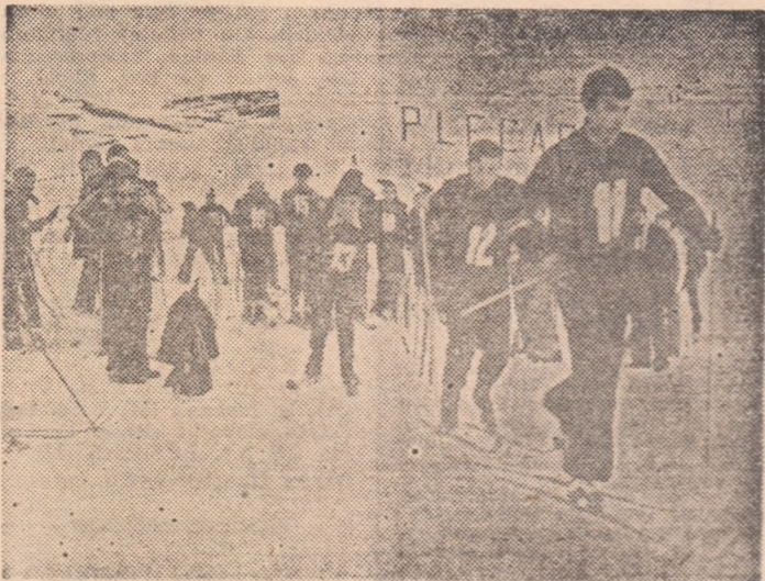
Start în proba „Complexul aplicativ pentru apărarea patriei“ din programul „Zilelor schiului pentru tineret“ de la Bistrița

la orașul Bistrița în marș de fanfară sint copii de la munte. Au fost invitați din întregul județ să participe, sub genericul „Daciadei“, la „Zi-