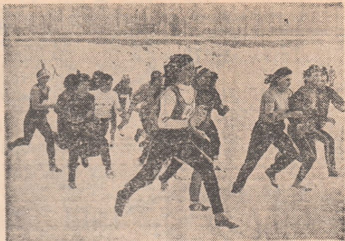
Aspect din cursa senioarelor la crosul dotat cu „Cupa Olimpia”