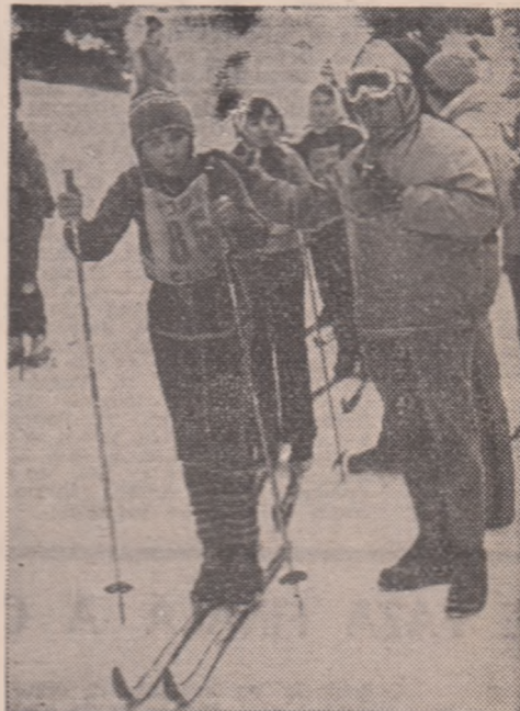
Se dă startul în proba de schi fond. Vă plac băsmăluțele concurenților 2 și 3?