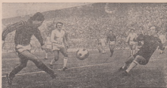
Franco Baresi, într-o acțiune ofensivă în meciul cu Catanzaro (4-0 pentru Milan)

dul Italiei, au jucat fotbal în formația comunei, fiind descoperiți ca autentice talente de... prelatul localității. Acesta, văzând că cei doi frați talentați se pierd în anonimat, s-a prezentat cu ei la clubul milanез Inter, al cărui suportor era. Aici, cu prilejul testului la care au fost supuși, numit Giuseppe a fost reținut... Ce va face micul Franco? — se întreba suportierul celor doi. „Vom încerca la concurență, la A.C. Milan” și-a spus el. Franco Baresi a intrat în echipa de juniori și apoi a fost promovat cu mult succes în prima formație de seniori, dovedindu-se o adevărată revelație! Se spune acum că Milan este lider, în mare parte grație aportului lui Franco Baresi.