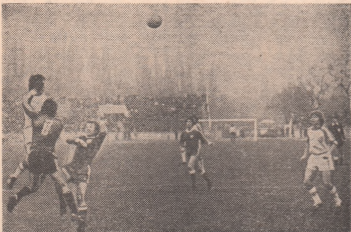
Tălănar câștigă duelul cu Ariciu și trimite „cu boltă”, înscriind golul victoriei bucureștene