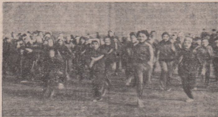
Startul fetelor în „Crosul Mărțișorului” de la Buzău

„ASTA-I DATORIA ȘI SATISFAȚIA NOASTRĂ, SĂ ASIGURĂM O ACTIVITATE NON-STOP... ...MAI ALES CĂ VINE PRIMĂVARA!”