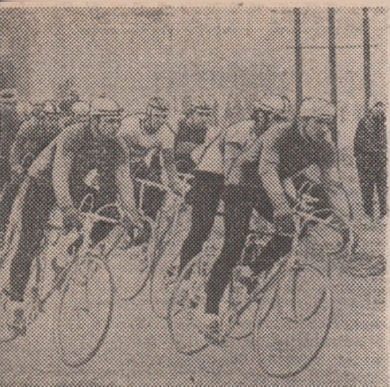
...a seniorilor. 43 de sportivi au pornit dezură la sezonului.

Petrolul, echipă din seria a V-a a Diviziei C. ● LA CLUJ-NAPOCA s-a disputat meciul restanță din etapa a XV-a a campionatului Diviziei C (seria a IX-a) dintre formația locală Tehnofrig și fruntașii seriei, Strungul Arad. Victoria a revenit cu 5-0 (3-0) echipei arădene. ● LOTUL NAȚIONAL DE JUNIORI a jucat duminică la Rogiori de Vede cu divizionara C ROVA. A cîștigat ROVA cu 1-0, prin golul marcat de Armeanu. (T. NEGULESCU - coresp.). ● LA CIMPULUNG MOLDOVENESC s-a desfășurat cea de a V-a ediție a „Cupei Rarău”, organizată de A.S.A. din localitate și la care au participat patru divizionare C. Trofeul a revenit formației C.F.R. Pașcani (6-5 în prima zi cu Cetatea Tg. Neamț), care a dispus în finală cu 1-0 de A.S.A. Cimpulung. (A. ROTARU - coresp.). ● DUPĂ CUM AM FOST ÎNȘTIINȚAȚI, excursia proiectată pentru duminică 11 martie la Sornicești, cu prilejul meciului Viitorul - Rapid, din seria a II-a a Diviziei B, nu se mai organizează.