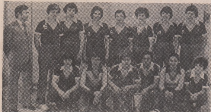
Confecția București, cîștigătoare a celei de a doua ediții a „Cupei României” la handbal feminin