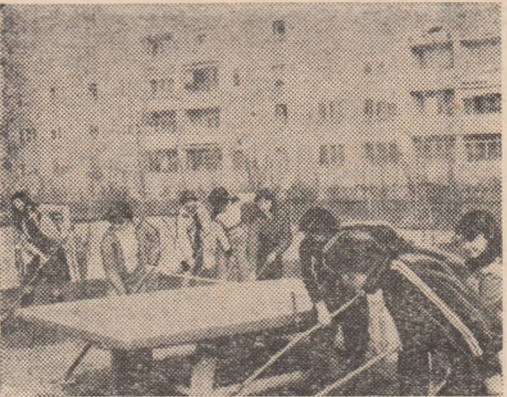
Elevii clasei a X-a L9 de la Liceul Industrial nr. 6 efectuînd, într-una din zilele trecute, muncă patriotică la baza sportivă „Titanii”

țul inițial a fost nevoie de intervenția de ultimă oră a primarului Sectorului 8, care, vizitînd acest complex, a fost nemulțumit de aspectul său neîngrijit. Aparținînd Administrației domeniului public și Casei pionierilor și școlimilor patriei din sector, „Cireșorii” s-au văzut în ultima vreme cu doi... părinți vitregi, fiecare lăsînd grija întreținerii pe seama celuilalt. Așa se face că profesorii de aici și șeful bazei trebuie să facă față cum pot diverselor necazuri mai mari sau mai mici. Intervenția tovarășului primar a fost binevenită, unele colective de oameni ai muncii din împrejurimi sînd imediat în ajutor, astfel că, în ultimele zile, s-a lucrat cu spor la întreținere și reamenajare. Dar, ar fi de dorit ca și problema apartenenței să fie clarificată, credem noi, în favoarea Casei pionierilor, care, de altfel, și-a exprimat de multe ori dorința de a deveni un... părinte grijuliu.