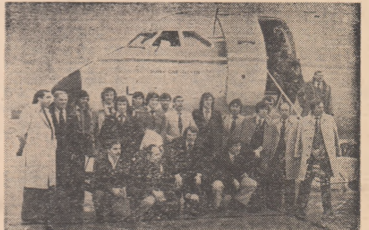
„Sevență” de pe aeroportul din Craiova: fotbaliștii spanioli, la puțin timp de la sosire

CRAIOVA, 2 (prin telefon). Lotul reprezentativ al Spaniei a sosit la Craiova luni seară la bordul unui avion al companiei TAROM. Jucătorii oaspeți s-au bucurat de o călduroasă primire, sute de iubitori ai fotbalului așteptîndu-i la hotelul Jiul și aplaudîndu-i cu căldură. La puține minute după sosire, cel mai celebru jucător al lotului spaniol, Asensi, ne declara următoarele: Craiova ne-a întîmpinat cu multă prietenie și simpatie. Rareori ne-a așteptat la sosire, în țările în care am jucat, un număr așa de mare de tineri voioși și simpatici, care ne-au urat bun soțit”. În privința jocului, vedeta lui C.F. Barcelona ne-a spus: „Pentru noi este o partidă extrem de grea pentru că echipa României reprezintă o forță și jocul ei de la Valencia a do-