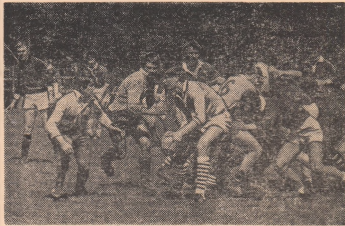
Ciștigat la o grămadă ordonată, balonul este transmis liniei de treisferturi a selecționabililor