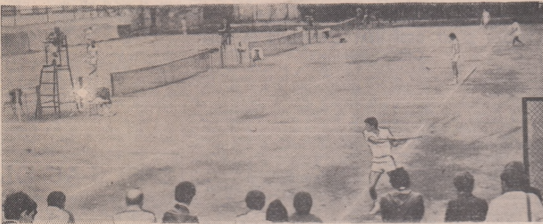
Patru din cele opt terenuri pe care au început meciurile Campionatelor internaționale de tenis ale României.

Campionatele internaționale de tenis ale României au debutat ieri, pe terenurile Progresul din Capitală, cu meciuri preliminare care au angajat masa jucătorilor români. De astăzi, începînd de la ora 10, competiția va primi mai multă culoare, odată cu intrarea în concurs a majorității tenismanilor străini (din opt țări de pe trei continente).