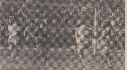
Fază din meciul Sport Club Bacău - Steaua (2-1): fundașul băcăuan Panaite șutează la poarta bucureștenilor

Rezultatele ne-au fost transmise de către corespondenții noștri voluntari din localitățile respective.