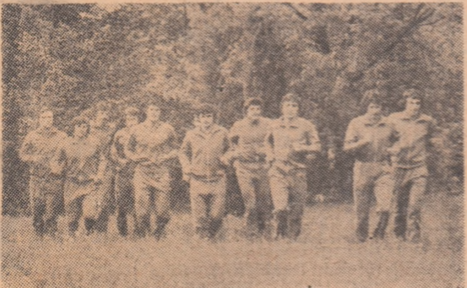
Introducere în efort, sub forma unui scurt cros în pădurea de la Snagov, înaintea antrenamentului efectuat, ieri, de selecționabili.