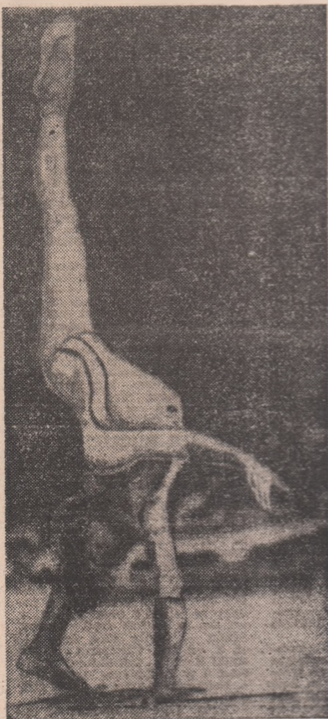
Virtuozitate, grație și armonie! Nadia la Copenhaga