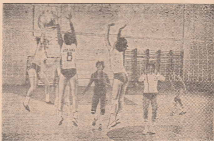
Campioanele balcanice, componentele reprezentativei de volei a României, se pregătesc cu asiduitate pentru a urca, din nou, pe treapta cea mai înaltă a podiumului