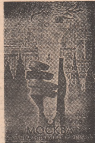
„Moscova, capitala celei de-a XXII-a Olimpiade” — așii de B. Loghinov și A. Markelov

Desigur, toate cele descrise mai sus vor putea fi văzute nu numai de spectatorii aflați pe traseul uriașei caravană, ci și de cei ce se vor găsi în fața micilor ecrane ale televiziunii în coloana de mașini ce va însoți pe purtătorii torței olimpice se vor afla și camerele de reportaj T.V., care vor asigura transmisiă directă (sau înregistrată) a acestui tradițional prolog al Jocurilor. (Rd. V.)