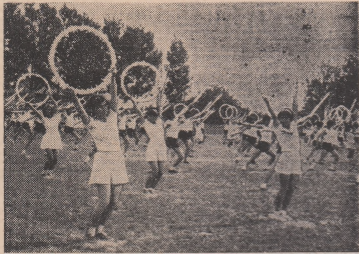
Grație și măiestrie — moment din Festivalul sportului sălăjan, desfășurat duminică la Zalău.

Festivalul sportului sălăjan a unit, duminică, pe stadionul din Zalău, gătit în cel mai sărbătoros localnic, peste 5.000 de tineri din unitățile de învățământ ale reședinței județului. La acest număr s-au adăugat câteva sute de invitați de pe cele opt văi ale Sălajului. De ce Festivalul sălăjan a fost nu numai o competiție, El s-a constituit ca un spectacol omagial al „Dacia-dei“, o încununare sărbătorască a concursurilor unite sub denumirea „Cupa Văilor“, un îndrăgît complex de întreceri pentru tineretul studios din mănăstălele ținuturi ale Almașului și Someșului, Barcăului, Crasnei, Agrijului, Zalăului... Ur-măream coloanele intrând în pag cadentat, pe pista stadionului, în aplauzele mărilor de spectatori și ne gindeam la sutele de băieți și fete veniți la finala „Văilor“, la emoțiile pe care le-au trăit aceștia, aici, timp de două zile. Emoții, pentru că ei, cei câteva sute, erau cei mai buni din 35.000 de participanți la fazele de masă ale amplei acțiuni.