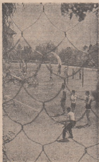
În curtea liceului, la ora de... volei