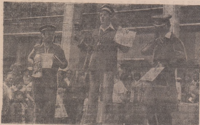
Cei mai buni sportivi dintre factorii poștași pe podiumul de premiere.

Trenul 8061 Intîrzie, intrînd în gara din Tulcea într-o dimineață care nu s-a hotărît încă să fie sau nu frumoasă. Casa de cultură e la un pas, tot lângă Dunăre, atît de aproape de parcă se înalță chiar din fluviu. În fața edificiului, o mare de uniforme, bleumarin: nenuntrați poștași, de parcă toate scrisorile ar fi luat drumul municipiului de la Dunăre. Dar astăzi, numai astăzi, gențile factorilor sînt îngreunate arbitrar, cu săculeți de nisip. Pentru că acum poștașii noștri de fiecare zi nu au de împărțit corespondență, colete sau presă. Ei — mai bine zis 76 concurenți (36 fiind femei) — au venit la Tulcea din toate colțurile țării, pentru a se întrece în sport, lucru mai mult decît firesc dacă ne gîndim că meseria lor este, prin esență, sportivă. Factorul poștal face zilnic 20 de kilometri și mai bine, cel mai adesea pe jos, deși această imagine clasică tinde să treacă în amintire, bicicleta devenind un accesoriu tot mai prețuit.