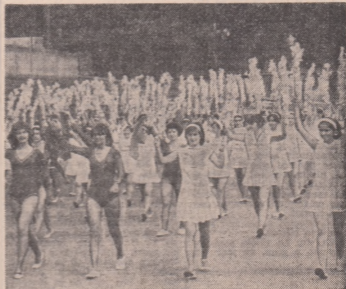
Un aspect de la defilarea participanților la Festivalul tehnico-aplicativ, sportiv și de pregătire pentru apărarea patriei, care s-a avut loc la Galați.