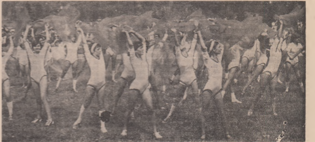
Grație, frumusețe, optimism, dragoste de viață sub soarele luminos al României socialiste, iată ce exprimă această frumoasă repriză de gimnastică ritmică modernă a reprezentanților cravatei roșii cu tricolor.