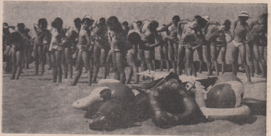
Primele zile ale vacanței la mare, primele zile în care acțiunea „Inotul pentru toți” are un cadru larg de desfășurare

oltean, ciberat de miza ● „Finala” de pe Dinamo se televizează în direct