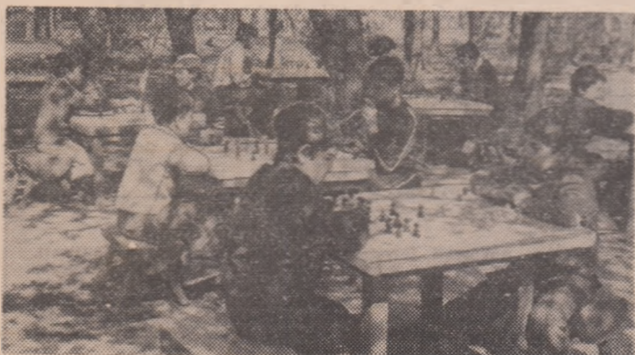
Secvență cotidiană de vacanță la mesele de șah din parcul sportiv bucureștean „Ciresarii”