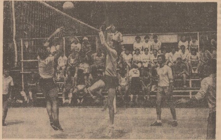
Dispută dîrză între echipele de volei ale asociațiilor sportive I.O.R. și „Chimia“ la Festivalul tineretului din Sectorul 4 al Capitalei.

Festivalul tineretului din Sectorul 4 al Capitalei, organizat sub genericul „Daciadei“. Acțiunea a început, de fapt, cu o săptămîină în urmă, inițiată de Comitetul U.T.C., în colaborare cu Consiliul pentru educație fizică și sport, și a constat din întreceri sportive în școli și întreprinderi, la volei și baschet, minifotbal și handbal, tenis de masă, șah, inot. O săptămîină de dispute inter-clase și inter-secții pentru „Cupa festivalului“ și pentru dreptul de participare la finală. Și iată-i pe cei mai buni, duminică dimineață, la baza sportivă „Timpuri noi“ de pe Calca Duduști.