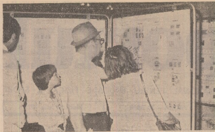
Exponatele cu tematică sportivă atrag, în holul Ateneului Român, oameni de toate vîrstele...