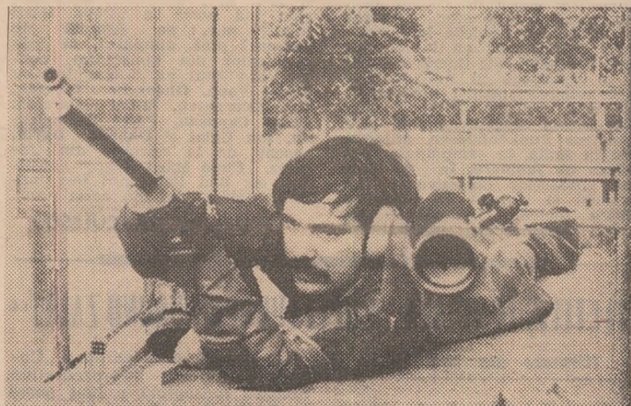
Romulus Nicolescu, campion internațional al României, ediția 1979, la proba de pușcă liberă 60 f.c.