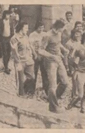
Jucătorii de la Steaua pornesc spre un nou antrenament.

În vederea pregătirii viitorului campionat, Steaua s-a reunit la București la 17 Iulie. Conducerea tehnică, tot tandemul vechilor coechipieri de la C.C.A., Gh. Constantin și V. Zavoda. În aceeași zi s-a plecat la Brașov. Astăzi, cu partida de la Cimpina, se încheie prima parte a pregătirii, „perioada Brașov”. Pentru săptămânile următoare programul prevede acțiuni urmă-