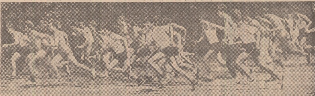
Crosurile se numără și în județul Ialomița printre cele mai populare competiții sportive de masă