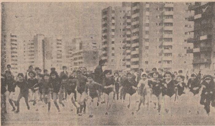
Crosurile, una din marile bucurii ale copiilor...

Un carnet de reporter in județul Olt, in aceste zile din preajma aniversării celui de-al 35-lea an al libertății noastre și a întimpinării Congresului al XII-lea al P.C.R., devine neincăpător pentru consemnări. Pentru că fiecare oraș, fiecare comună sau sat poartă, ca pre-tindenți în țară, amprenta celor două mari momente politice, reprezintă un teritoriu de istorie, de fapte și năzuinți, care apar tot mai mărețe! Locuitorii județului Olt sînt parcă mai căliți în lupta cu timpul, cu ei înșiși. Călăuziți de învățătura partidului, oamenii de pe aceste frumoase meleaguri (ce se întind, într-o armonie de culori, de la firul de argint al Dunării către clinurile dealurilor împodobite cu întinse livezi de pomi fructiferi) au învățat că în acești ani luminoși de după Eiliberare, rodul muncii lor se cheamă bunăstare. De aici mindria tuturor de a produce mai mult și mai bine, la parametrii socialismului. „Nu preocupăm nici un efort — ne spunea un tânăr maestru lăcătuș de la Depoul C.F.R. Piatra Olt — pentru propășirea țării noastre scumpe. O facem cu drag, pentru că sîntem stăpîni pe munca noastră, sîntem producători și beneficiari. Merită ca patriei să-i sporim necontenit frumusețea și bogăția!...” O asemenea concepție despre muncă și viață explică și reușitele celor din județul Olt, motivează verticalele înălțate spre bucurie, apariția uriașelor platforme industriale de la Slatina, Balș și Caracal. Împreună cu cei de pe ogoare, oamenii de aici ra-