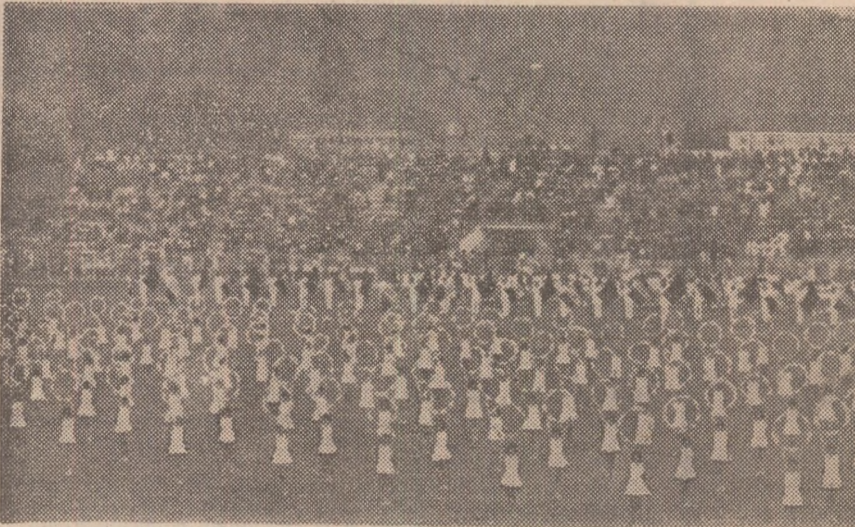
Deschiderea anului școlar este un prilej pentru organizarea unor frumoase manifestări la Piatra Neamț.