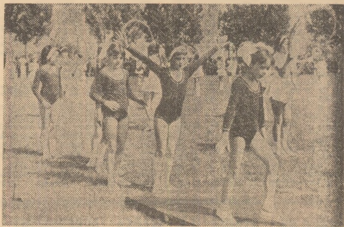
Alături de întrecerile „Daciaei”, „Festivalul sportului sălăjean” reprezintă marea sărbătoare sportivă a tineretului de pe aceste meleaguri

Vitregiile istoriei au frinat dezvoltarea economică a Sălajului, situându-l printre județele cele mai slabe. În anul eliberării patriei - 1944 - pe întreg cuprinsul Sălajului nu