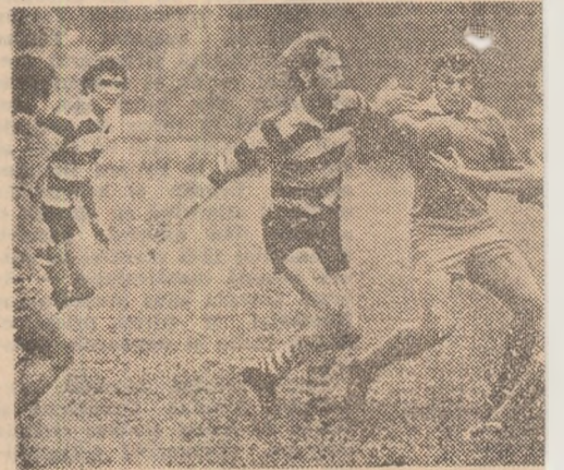
Dinamovistul Parasciv culege un balon, care e... și Vieru. (Fază din meciul Dinamo — Știința) Foto

UNIVERSI — ȘTIINȚA 12-13 (3-6) ză pe maluri din Maramu după un joc Matel, de la (nat). Au me Peter (drop de... „U”; respecti cale (cite o tr.). A arbi CRETU, POLITEHN BRAȘOV 18-8 (Incer Popa (drop, hăescu (d.p.) RULMENTI SPORTUL, Birlădenii au cazul, dar ai denților le-a St. Rădulescu cioresp.). C.S.M. SIB Teren desfur cat, dar au NESCU — co