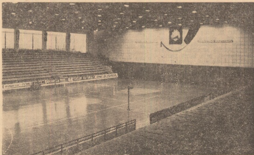
Pentru ca educația fizică și sportul să se dezvolte din plin, partidul și statul nostru au acordat și acordă o grijă deosebită creării bazei materiale necesare. În cei 35 de ani de la Eliberare, în numeroase localități din întreaga țară au fost construite moderne complexe sportive, stadioane de mare capacitate, săli de sport cu funcționalitate multiplă, patinoare artificiale, bazine de înot etc., care găzduiesc numeroase întreceri sportive interne și mari competiții internaționale. În același timp, prin munca patriotică a mii și mii de cetățeni, îndeosebi tineri, folosindu-se resurse locale, s-au amenajat terenuri de sport simple pe lângă întreprinderi, instituții, în școli și în cartierele de locuințe, pe care se desfășoară întreceri de masă în cadrul competiției sportive naționale „Daciada”. (În foto: Sala sporturilor din Bala Mare)