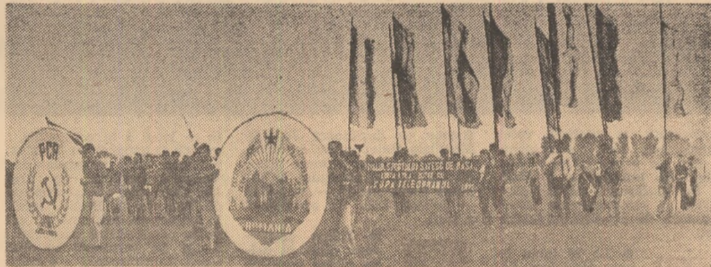
Sportul a devenit un prieten bun al locuitorilor satelor și comunelor țării. Atletismul, luptele, boxul, fotbalul, handbalul, tenisul de masă și alte ramuri sportive cunosc o largă răspândire la sat. Sportul de performanță își trage seva și din izvorul nescăpat al talentelor existente în mediul rural. An de an, la festivalurile sportului sătesc din județe participă mii și mii de concurenți. (În foto: aspect de la finala unui asemenea festival în județul Teleorman)