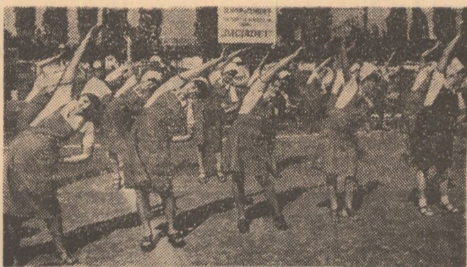
În tot mai multe întreprinderi, gimnastica la locul de muncă a devenit un fapt cotidian. Mii și mii de oameni ai muncii o practică cu convingerea că îi ajută să-și păstreze și să-și întărească sănătatea și capacitatea de efort, pentru ca productivitatea și eficiența muncii lor să progreseze continuu. (În foto - La Filatura română de bumbac din București, gimnastica e o componentă nepăsită a activității tinerelor fete)