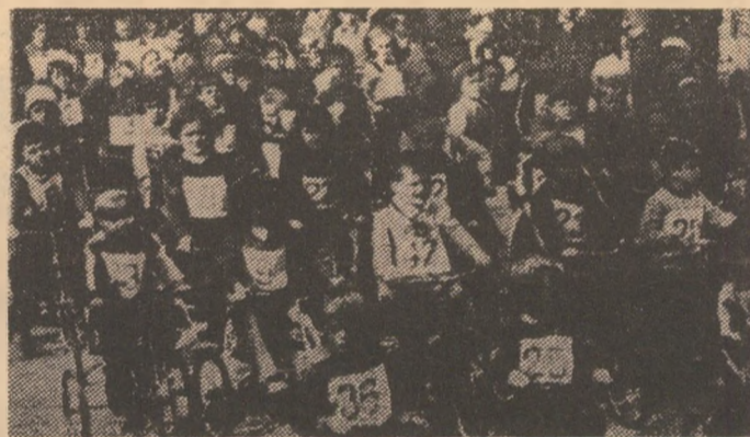
Bucurându-se de grija părintească a partidului, copiii și tinerii, viitorii constructori ai socialismului și comunismului, cresc plini de vigoare, practicând zilnic mișcarea, exercițiul fizic, sportul. Le stau la dispoziție amenajările sportive din grădinițe și școli, ca și sălile și stadioanele. Societatea noastră face totul pentru a asigura copilăriei posibilitatea afirmării plene în toate domeniile, inclusiv cel al marii performanțe.