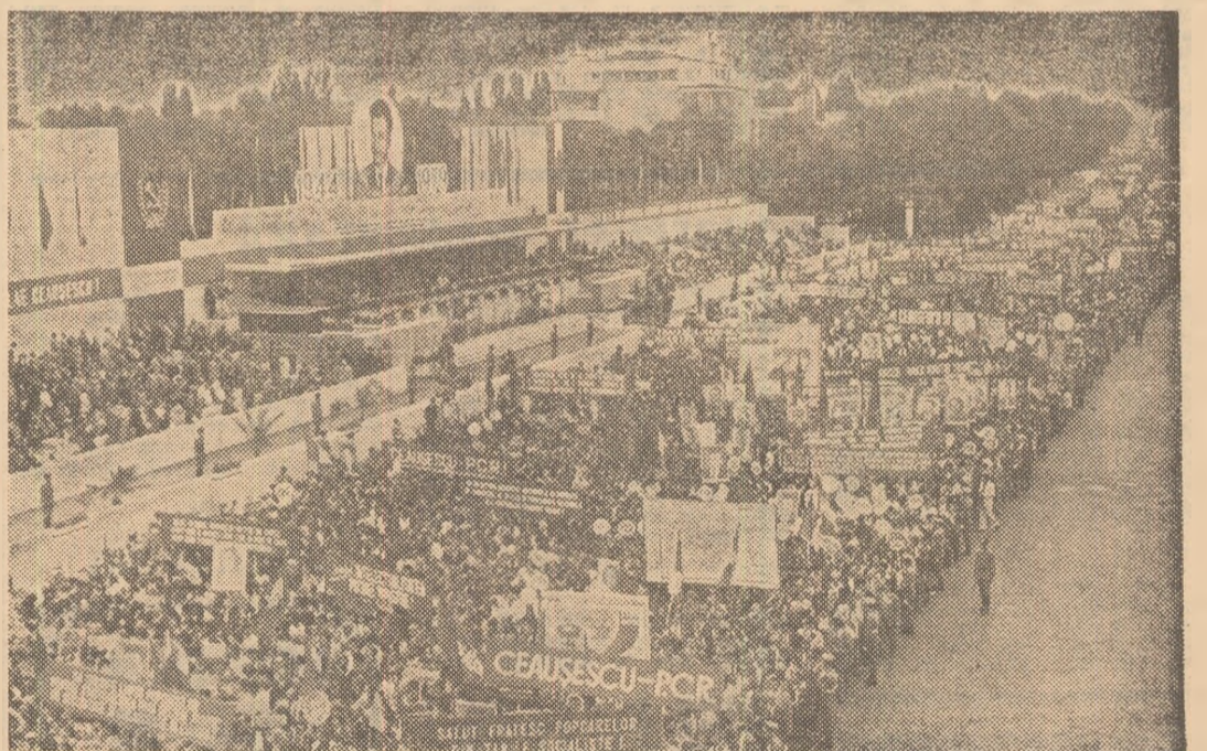
Aspect de la demonstrația oamenilor muncii.

CONSTANTIN ALEXANDRU — PENTRU A DOUA OARĂ CAMPION MONDIAL LA LUPTĂ GRECO-ROMANE