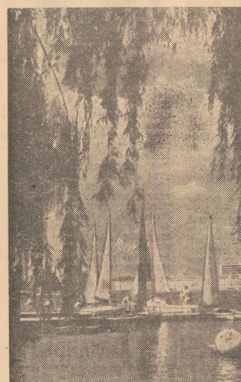
In „rada” portului Tei, ambarcațiunile cu pinze pornesc pe lac sau acostează neîncetat timp de o zi-lumină...

s-a sit cu Ur ria: Pe M.S.C. și 26— Unive ria) cel m golur