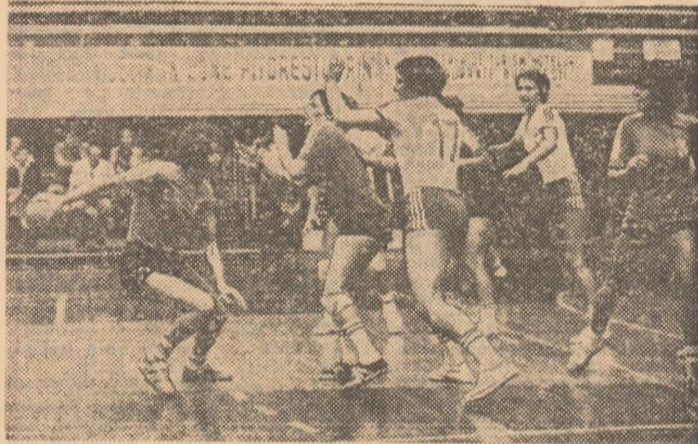
Fază dintr-unul din meciurile campionatului trecut, în care s-au întâlnit, la București, Progresul și Știința Bacău, campioana țării